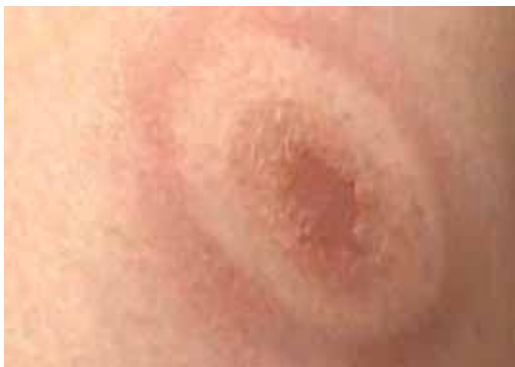
Figura 2 Tipico eritema nello stadio iniziale della borreliosi.

Terzo stadio (anni dopo la puntura) La pelle presenta alterazioni cutanee estese (assottigliamento e colore rosso-violaceo), raramente vi possono essere alterazioni croniche a carico del sistema nervoso o delle articolazioni.