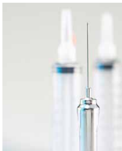
Figura 5 La vaccinazione contro la FSME offre una valida protezione.